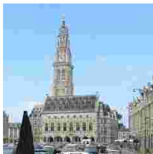
Le beffroi d'Arras

Alimentation et développement durable : un lien fondamental entre les hommes de cette planète