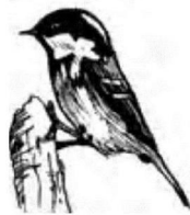
La mésange noire

"sur la gauche le château des Templiers et son bassin."