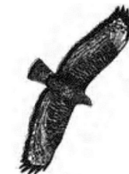
La buse variable

D'ici quelques années on aura bouffé la feuille Et tes petits enfants ils n'auront plus qu'un œil En plein milieu du front ils te demanderont Pourquoi t'en as deux et tu passeras pour un con Ils te diront comment t'as pu laisser faire ça T'auras beau te défendre leur expliquer tout bas C'est pas ma faute à moi c'est la faute aux anciens Mais y'aura plus personne pour te laver les mains Tu leur raconteras l'époque où tu pouvais Manger des fruits dans l'herbe allongé dans les prés Y'avait des animaux partout dans la forêt Au début du printemps les oiseaux revenaient.